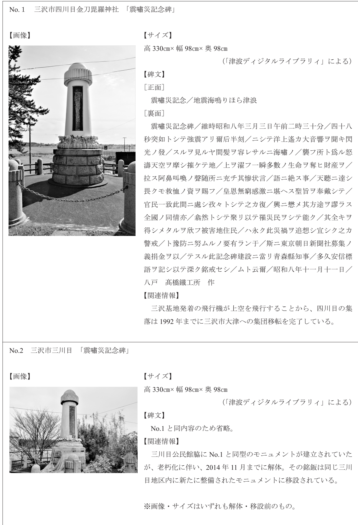
表 2 青森県太平洋沿岸部に所在するモニュメントの基礎データ