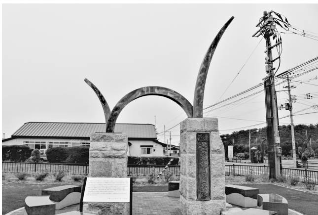
写真1 No.2のモニュメントの銅板が移設された新モニュメント

400基近くの存在が確認されているモニュメント群の中でも異質なものの一つである。