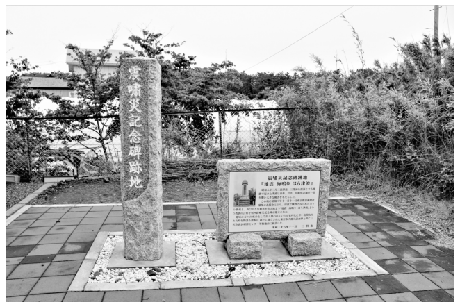
写真2 No.2のモニュメント跡地に設けられた新モニュメント

当時の百石町域の中でも特にこの場所が選ばれた理由としては、明神山公園が属する川口・明神山地区が、町内唯一の人的被害が発生するなど、被害が集中したエリアに当たったことによるものと考えられる (註19) 。